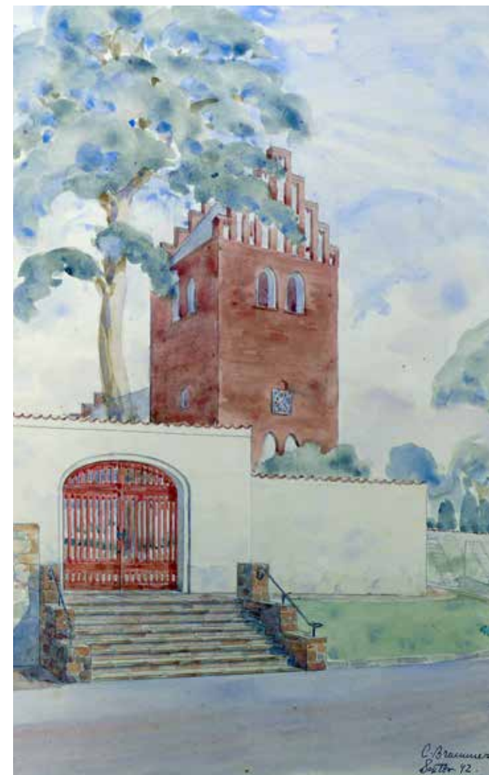
Carl Brummers akvarel af Tikøb Kirke