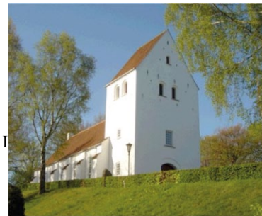
Vel mødt til en afslappet forårskoncert i den nys udprungne bøgeskov!

Som traditionen byder hilses somme- ren velkommen i Gurre Kirke med en koncert, hvor alle kan være med til at synge en række af de kendte og elske- de danske sommersange. Ideen med denne aften er tillige at give en plat- form for den lokale musikudfoldelse. de seneste år er flere medlemmer af kirkernes børne- og ungdomskor ud over sangen begyndt at udfolde de- res musikalske talenter på forskellige instrumenter. Derfor kan publikum glæde sig til et program rigt på klang- lig variation med flere instrumenter.