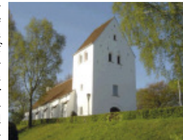
Vel mødt til en afslappet forårskoncert i den nys udprungne bøgeskov!

Efter koncerten byder menighedsrådet på en lille forfriskning.